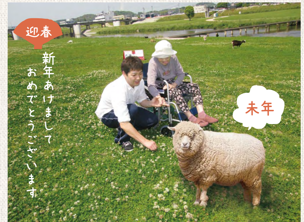
写真：院外レクリエーション/直方河川敷にて