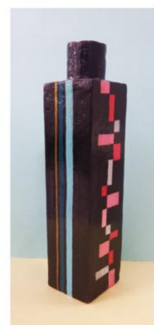
～精神科デイケアより～ 陶芸作品