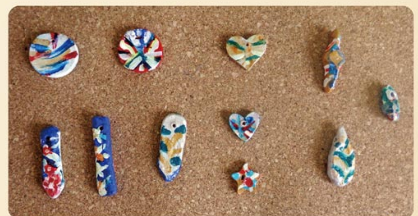
首飾り。実際に着用しています。