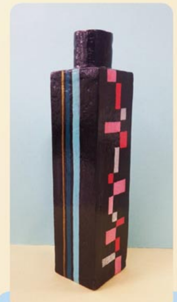
一輪さしです。こだわっています。