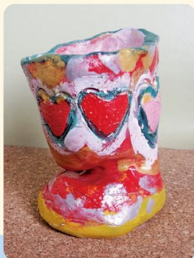
靴型のペン立てです。かわいい。