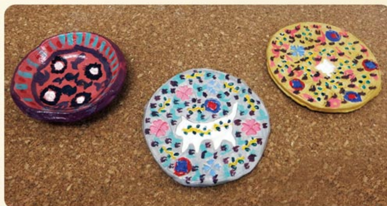
コースターです。色が個性的。