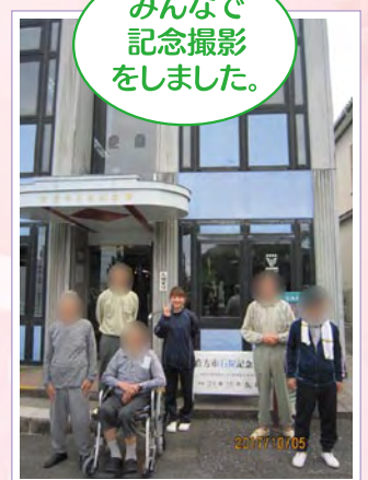
みんなで記念撮影をしました。

石炭記念館では案内人の方が説明をしてくれて、皆様、真剣に聞いていました。皆様、昔を思い出しながら話を聞かれ、自分の子供時代を話す方もいらっしゃいました。