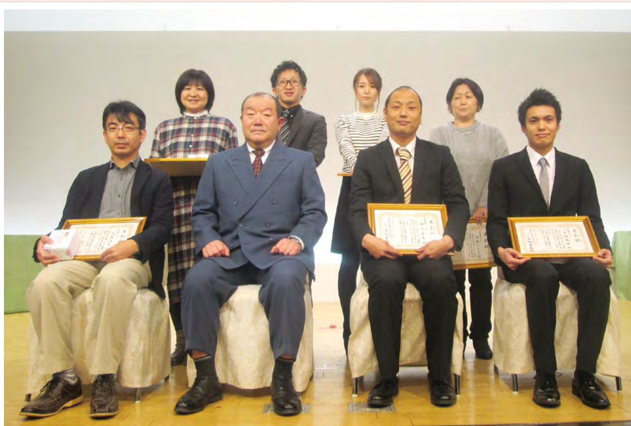
平成29年度温故会総会 永年勤続表彰者