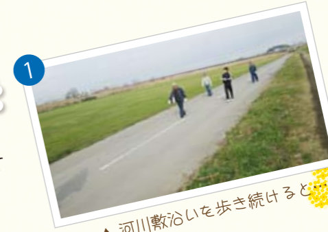
▲ 河川敷沿いを歩き続けると...

年明け第一回目の歩こう会のコースは初詣を兼ねて、毎年、“多賀神社”に行っています。遠賀川河川敷を横切れる歩道があるとの噂を聞き、車通りが少ないコースでもあるため、そこを通過して多賀神社に向かうようにしました。