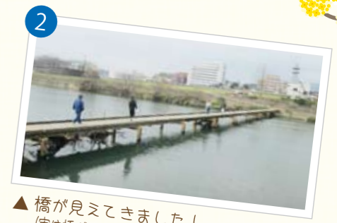
▲ 橋が見えてきました!(実は橋が全く見えてこず不安でしたが...笑)