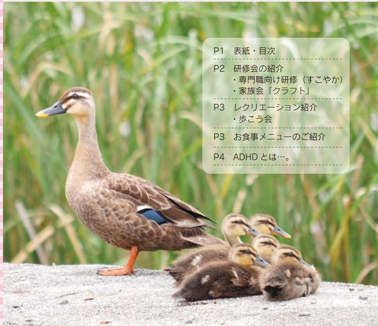
撮影場所：温故会敷地内にて