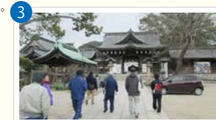
▲ そして、暫く歩き続けると目的地である多賀神社に到着!